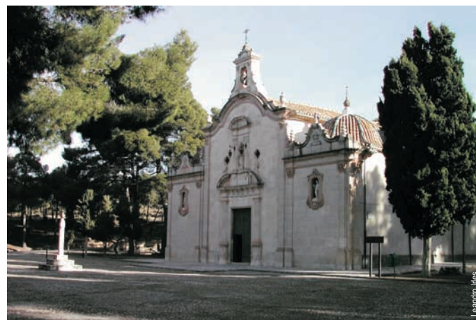
Santuario de Nuestra Señora de Gracia, Biar